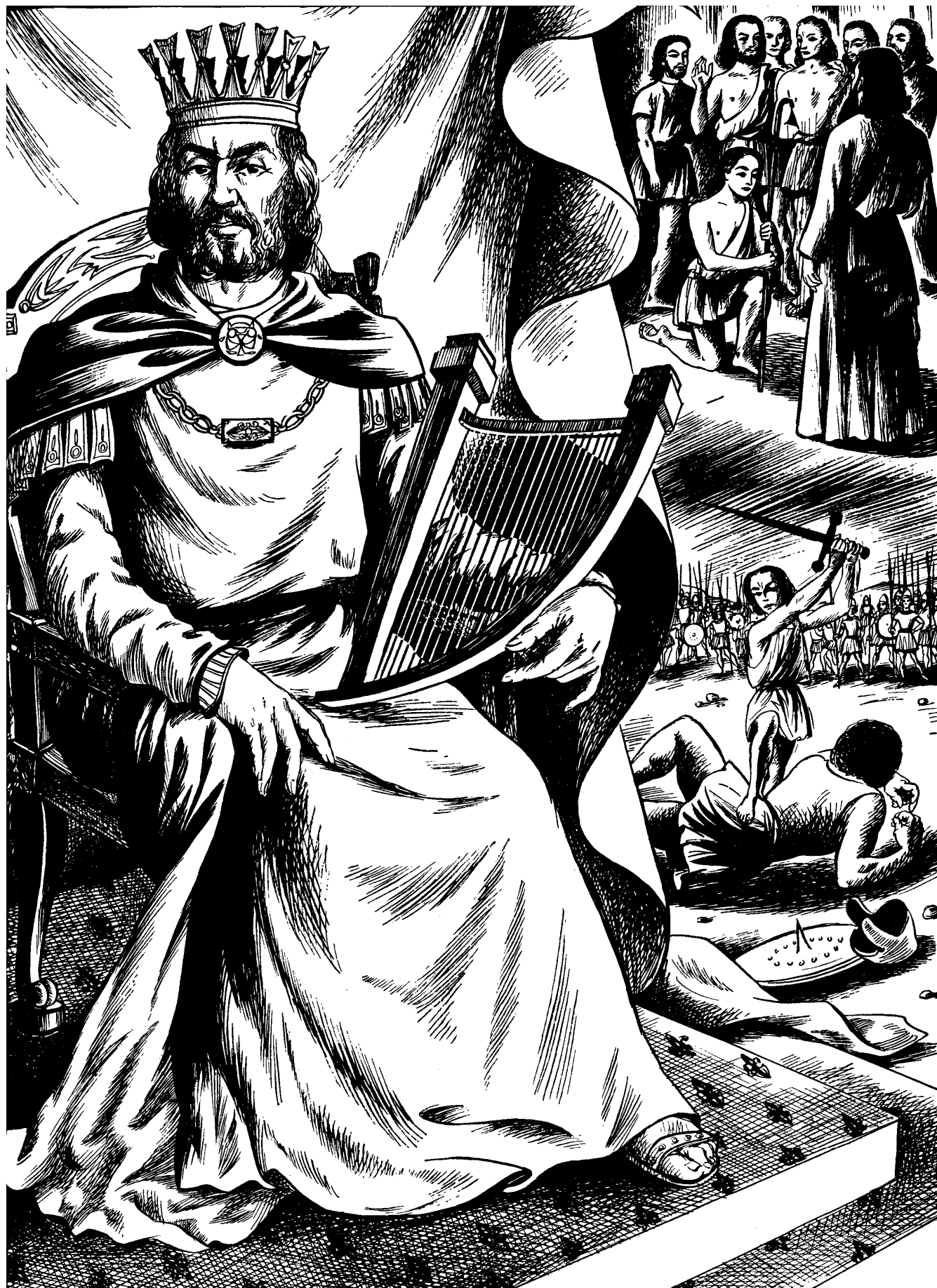
Le roi David, représenté avec une lyre car on lui attribue certains psaumes de la Bible. En haut à droite, David reçoit l'onction du prophète Samuel, signe que Dieu l'a choisi pour être le Messie de son peuple. En bas il terrasse le géant Goliath après l'avoir atteint à la fronde.